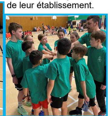
Photo du haut : le rassemblement des équipes avant le début du tournoi. Photo de gauche : l'équipe de l'école Notre-Dame a remporté chacune de ses sept parties. Photo du centre : les élèves de l'école Saint-Louis-de-Gonzague ont bien apprécié leur expérience. Photo de droite : les élèves de l'école Hébert se sont rendus en demi-finale.